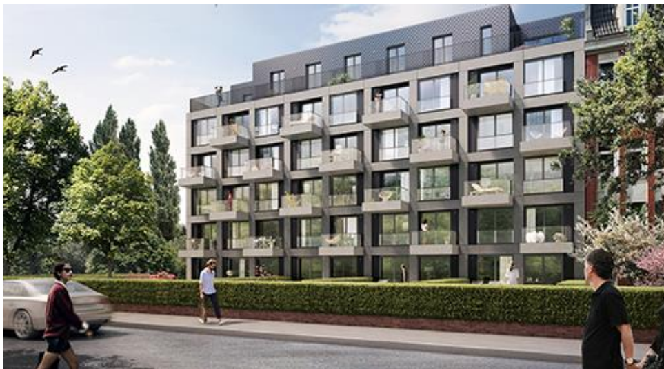
Visualisierung des Gebäudes Fritz Barmbek, Foto: bloomimages/Hamburg Team, Abdruck honorarfrei.